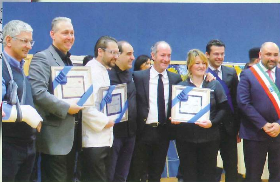
Le premiazioni del miglior gelato al Prosecco all'Antica Fiera di San Gregorio a Valdobbadiene

Sempre grazie a "Longarone Fiere", Funi- vie Dolomites Val di Zoldo e Uniteis lo si è gustato il 24 marzo sulle piste da sci di Val di Zoldo, dove si è lavorato con storiche macchine da gelato. Uno "spettacolo" che si replica da qualche anno e che non finisce